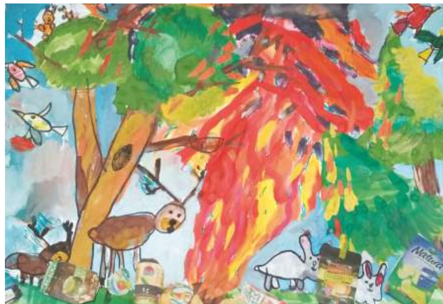
«Забери с собой!», МБУ Детско-юношеский центр г. Гурьевск, 2018

Мы любим лес, любим гулять в лесу. Любим тех, кто там живёт. Ради нас и лесных обитателей нельзя жечь костры и оставлять мусор!!!!