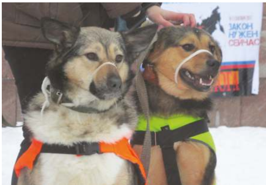
«Без названия», Карелия, 2017