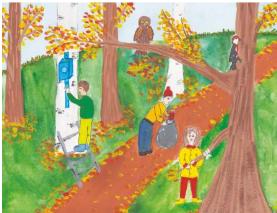
«Защитники природы», Нарьян – Мар, 2018

Природа — это краса нашей Земли. Она даёт нам пищу, кислород. Природой надо любоваться, а не разрушать её. Для природы важна каждая травинка, каждый кустик, каждая букашка. Я призываю своих сверстников: «Берегите природу! От нас зависит будущее нашей планеты! Сохраним природу – сохраним жизнь на Земле!»