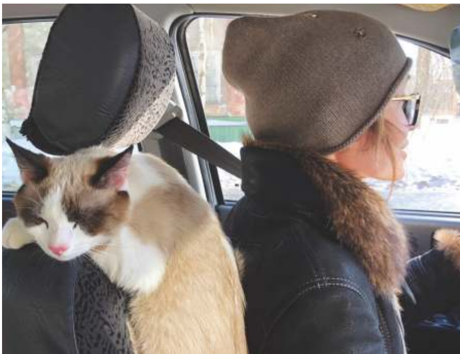
«Домой!», Архангельск, 2018

В сентябре 2017 года я с дочкой (5 лет) вернулись вечером домой, где нас ждал «сюрприз» — котенок (полтора месяца), который встретил нас в коридоре — «мяу-мяу». Первая реакция была — «ещё один?», «я ошиблась квартирой?», «что с ним делать?» (супруг в январе 2017 года, когда были крепкие морозы, принес с улицы котенка Матросика, который живет с нами и вот появляется второй). Супруг пожалел этого малыша — наш Персик — был грязный, жалобно кричал на улице, люди проходили мимо, на улице в конце сентября было уже холодно.