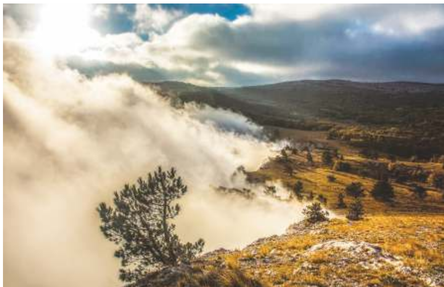
«Где рождаются облака?», Крым, 2017

Снимок был сделан на территории Ялтинского горнолесного природного заповедника, общая площадь которого достигает 14 523 га. Эти земли используются исключительно в научных целях, здесь осуществляется бдительный контроль ради сохранности зеленой зоны.