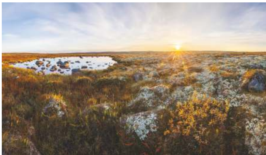
«Что такое тундра?», Териберка, 2017

Что такое тундра? Людям, которые никогда не бывали на Севере, это довольно трудно объяснить. Бескрайние безлесные просторы, покрытые ковром из мхов, лишайников, трав и кустарничков. Где каменные россыпи чередуются с зарослями карликовых берез и кустиков морошки, повсюду блестят зеркала мелководных озер, а в заболоченных низинах, прямо из воды выступают древние скалы.