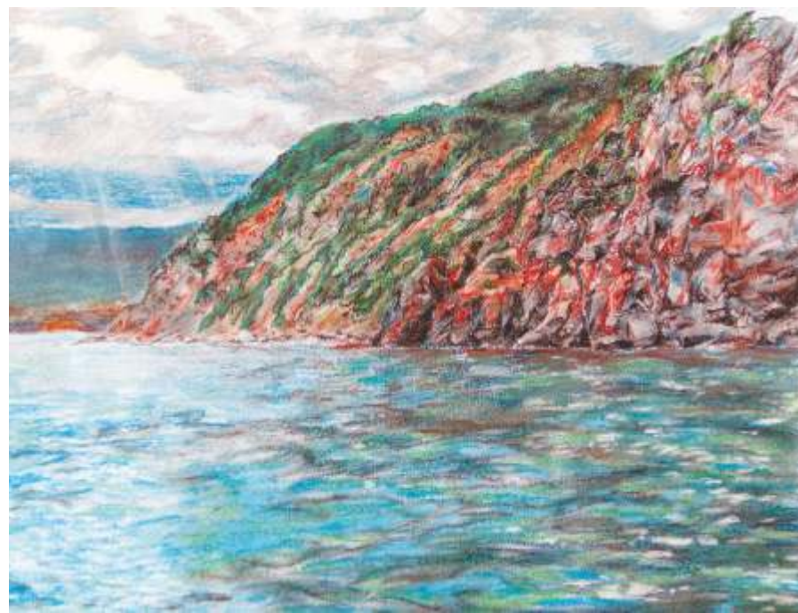
«Чистые источники», Карелия, 2017

Есть ещё немало уголков на Земле, где сохранилась природа в первозданном виде, где сохранились чистейшие источники воды, леса нетронутые цивилизацией. Такую красоту и чистоту не просто передать на бумаге, запечатлеть прозрачность и сияние природных водоёмов.