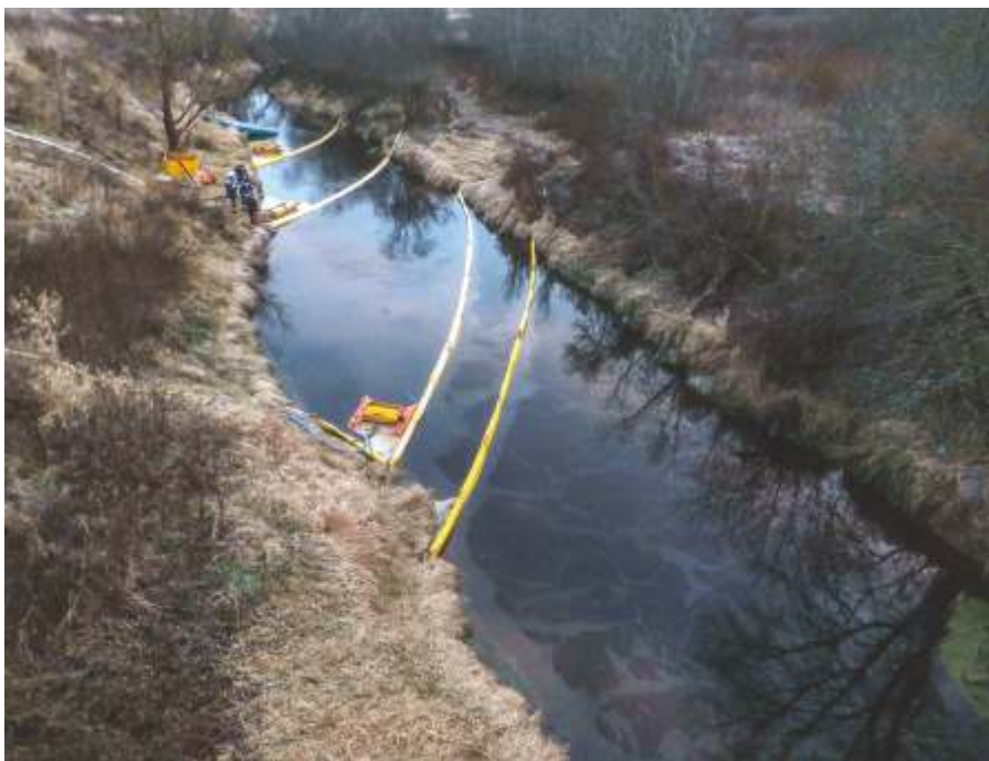
«Устранение нефтепродуктов на реке», Сестрорецк, 2018

Снимок был сделан мною 11 ноября 2014 года с моста через реку Тигоду. Выше этого места в районе поселка Сельцо в реку вылилось дизельное топливо из незаконной врезки в трубопроводе.