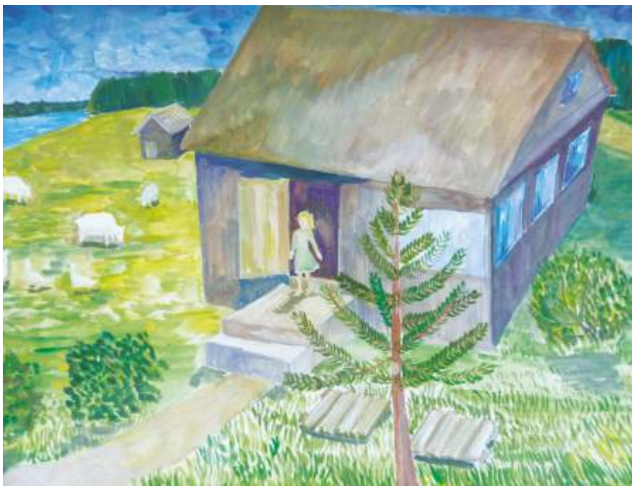
«Дом родной», Олонец, 2018

На своей картине я изобразила мой дом. В нем я родилась, с ним связаны лучшие мои воспоминания. У нас много домашних животных есть овцы, гуси, собаки и коты. Все они мои друзья. Я провожу много времени с ними.