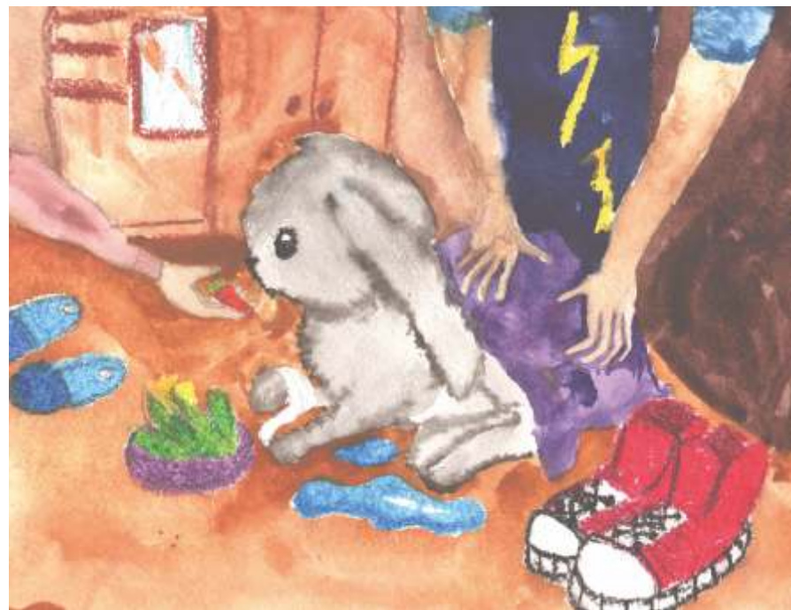
Без названия, Петрозаводск, 2018

Человек и животные, живем в гармонии и согласии. Чтобы жить в согласии с животными нужно их любить и о них заботиться. В мире происходит много явлений, которые затрагивают и человека и животных: засухи, пожары, наводнения, сильные заморозки. По мере возможности люди стараются помогать животным, но наверное этого недостаточно. Земля наш общий дом и если люди будут беречь природу, думать о будущих поколениях, то мы сможем существовать в гармонии и согласии с животными. На рисунке изображен зайчик, который попал в беду, люди вылечат его и отпустят обратно в лес, на свободу. Пусть мы не можем помочь всем нуждающимся, но если каждый будет делать то, что в его силах, многое изменится к лучшему.