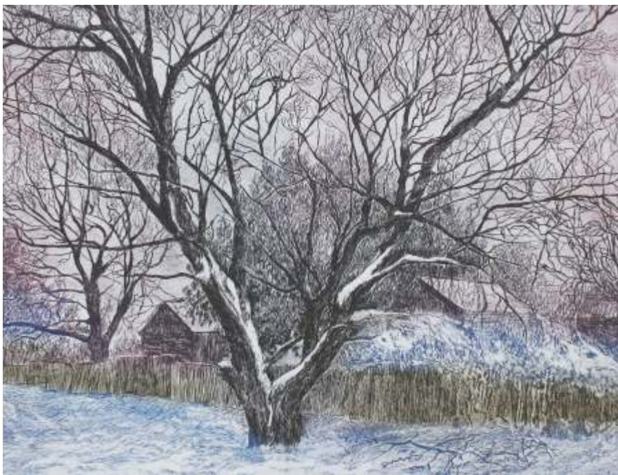
«Январь. Морозный вечер», Краснодар, 2011

В начале января дни ещё совсем короткие, но после самой длинной декабрьской ночи, стали понемногу прибавлять. Удивительно: ещё минуту назад был день, но в одно мгновение наступает ни с чем несравнимое состояние природы — солнце на закате окрашивает небо и края веток деревьев в пурпурные цвета. И пусть это явление имеет научное объяснение, связанное с изменением восприятия цвета, именуемое Эффектом Пуркинье, всё равно это чудо.