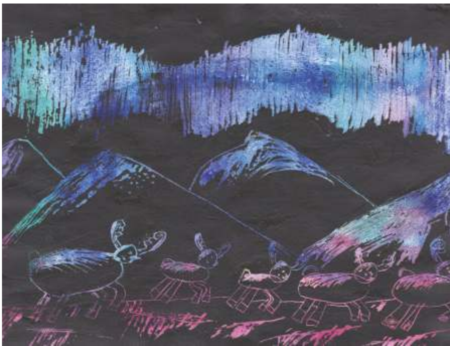
«Полярная ночь», Северодвинск, 2018

Моя бабушка живет в Мезенском районе Архангельской области. Когда я езжу к ней в гости, то всегда встречаюсь там со своими любимыми животными — оленями. К бабушке мы добираемся на машине, и когда по краям трассы начинают появляться олени, то сразу можно понять, что начался Мезенский район.