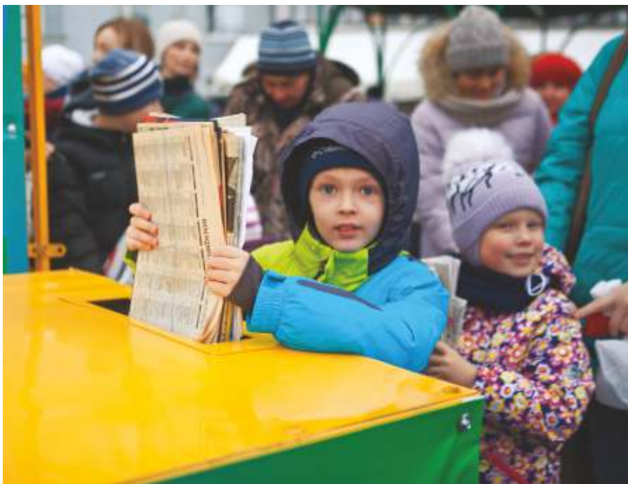
«Сдай макулатуру — спаси дерево», Вологда, 2017

Природные явления, пожары по вине человека, незаконная вырубка леса, отсутствие экологического просвещения — главные причины нарушения экосистем. К примеру, 15 июля 2016 г. около 2,5 гектаров леса сожгли отдыхающие в Череповецком районе Вологодской области. Месяцем раньше, в июне в лесах Кадуйского и Череповецкого районов было зарегистрировано два лесных пожара общей площадью около 2 га. Площадь лесов, пострадавших от урагана в Вологодской области, составляет более 75 тысяч гектаров, наиболее пострадавший лес в Грязовецком районе. В 2018 году выявлен случай незаконно заготовленной древесины порядка 20 тысяч кубометров, а материальный ущерб превысил 143 миллиона рублей.