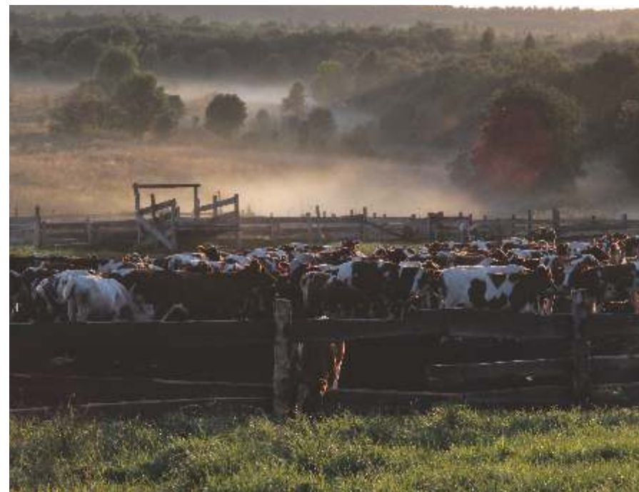
«Закат», Кузаранда, Карелия, 2015

Противоречивость фотографии заключается в том, что одомашненные животные, которых разводят для удовлетворения потребности человека, являются частью экономических отношений и сферы деятельности — животноводства, а так же целью и результатом деятельности сельскохозяйственных предприятий, как в малых, так и в больших формах, которые в настоящее время находятся в состоянии упадка и деградации. С другой стороны выращивая домашних животных, ухаживая за ними, человек не может не видеть гармонии результатов своего труда с природой и космосом.