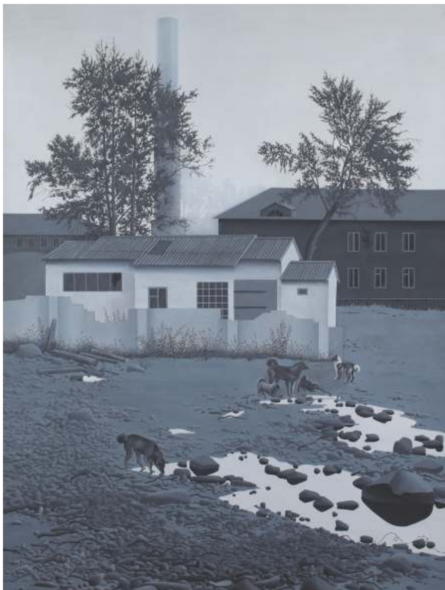
«Заводская окраина» из серии «Уходящая провинция» Петрозаводск, 2016-2017

Графический лист «Заводская окраина» из серии «Уходящая провинция» не претендует на эффект и броскость. Для работы я выбирала не исключительно красивое место, а старалась отыскать глубоко трогательные черты в непарадной стороне жизни, не притязательном на первый взгляд мотиве. Он отражает будни тихого двора небольшого провинциального города с его индустриальным прошлым, который стал мотивом творческой работы.