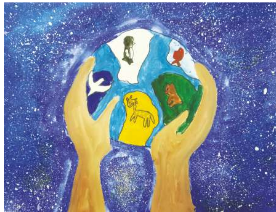
«Планета животных в наших руках» Студия Жар-птица МОУ ДО, Кондопога, 2018

Мой родной край Карелия. Это край тысячи озёр. Наша природа на первый взгляд очень сурова, но присмотревшись к ней понимаешь всю её красоту и многообразие животного мира. Очень жаль, что в наше время с каждым годом увеличивается количество животных занесённых в красную книгу. Хочется сохранить на земле как можно больше разных животных, птиц и рыб. Мой вклад в сохранность природы очень мал, пока я могу только сама относиться бережно к окружающему меня миру. Привлекать своих друзей и друзей. Отражать эту проблему в рисунках. Но становясь старше. я хочу продолжать своё дело в защиту нашей планеты.