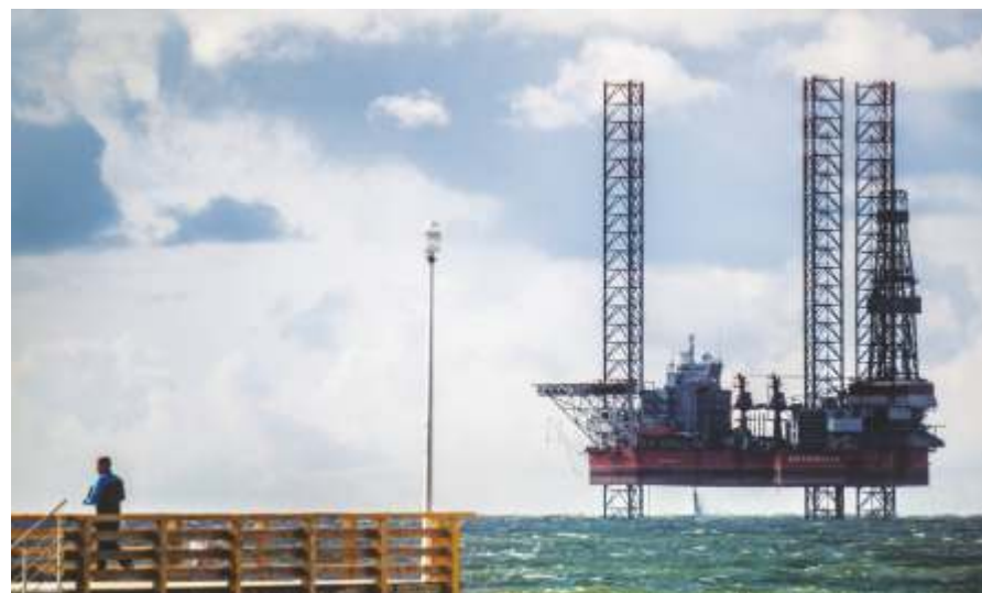
«Буровая платформа», 2014

Компания «Лукойл» собиралась начать разработку месторождения, которое находится в нескольких десятках от побережья в Балтийском море. Летом 2014 жители и гости города Зеленоградска увидели эту буровую платформу недалеко от берега. Это была величественная, но в тоже время пугающая картина. Мы все переживали, как это может отразиться на экологию края, моря и морских обитателях.