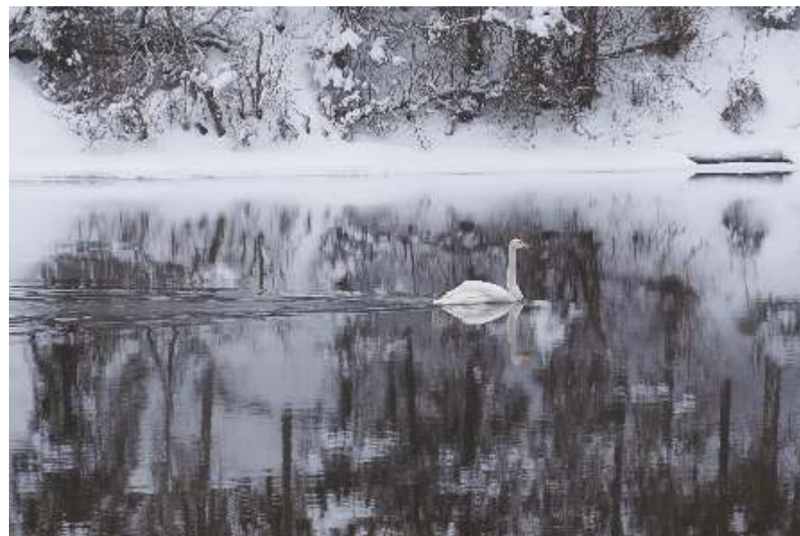
«Лебедь на зимней реке» Национальный парк «Паанаярви», 2016