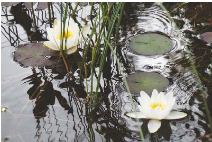
«Кувшинка шепчется с волной» Национальный парк «Паанаярви», 2013

«О шаловливом ветерке, что пролетает налегке, кувшинка шепчется с волной...»