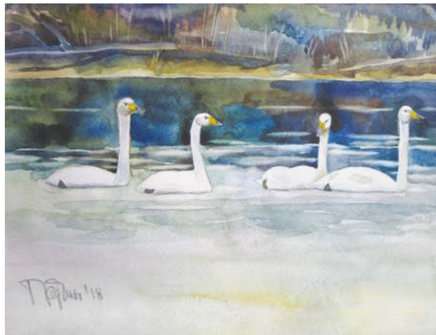
«Весна в Беломорской Карелии», Петрозаводск, 2018

В народном эпосе «Калевала» лебедь связывает потусторонний мир Туонела с миром живых. Вытягивая длинную шею вверх лебедь обзревает этот мир, опуская шею под воду наблюдает за подземным миром, который находится по ту сторону дна.