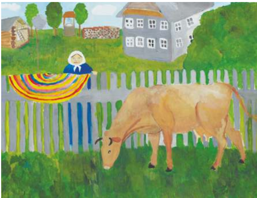
«Кормилица», Олонец, 2017

У моей прабабушки когда-то была корова. Она мне много рассказывала о ней. В своём рисунка я представила как это могло быть.