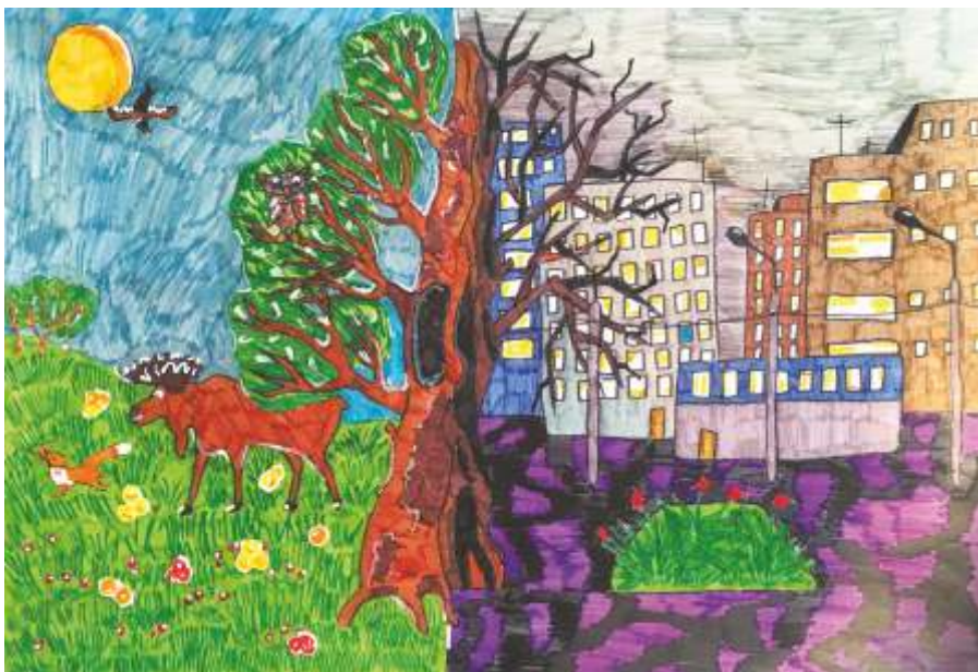
«Окружающая среда — это мы» Правобережный дом детского творчества, изостудия «Нарисованный мир» 2017

Есть одна цитата, которая очень подходит к этой картине: «Чем больше дров, тем дальше лес». В нашем мире почти нет ничего живого, всё заменила техника и камень, а деревьев и травы почти нет. Мы не дышим, мы пытаемся вдохнуть, не живём, а выживаем в нашем каменном мире. И моей картиной я попыталась показать, насколько мало осталось природы, и надеюсь, у меня это вышло.