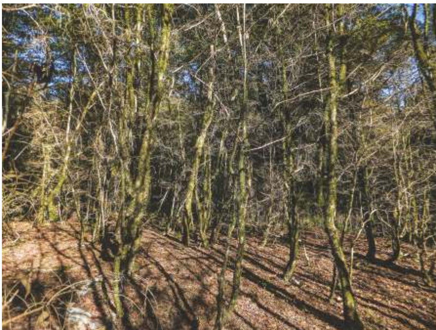
«Погибающая самшитовая роща», Сочи, 2017

Реликтовые самшитовые леса погибли в Краснодарском крае и Адыгее из-за бабочки огневки, которую завезли с растениями, купленными в 2012 году к Олимпиаде в Сочи. Летом 2014 года, когда вымерли деревья Хостинской тисо-самшитовой рощи огневку еще можно было остановить, обработав пестицидами.