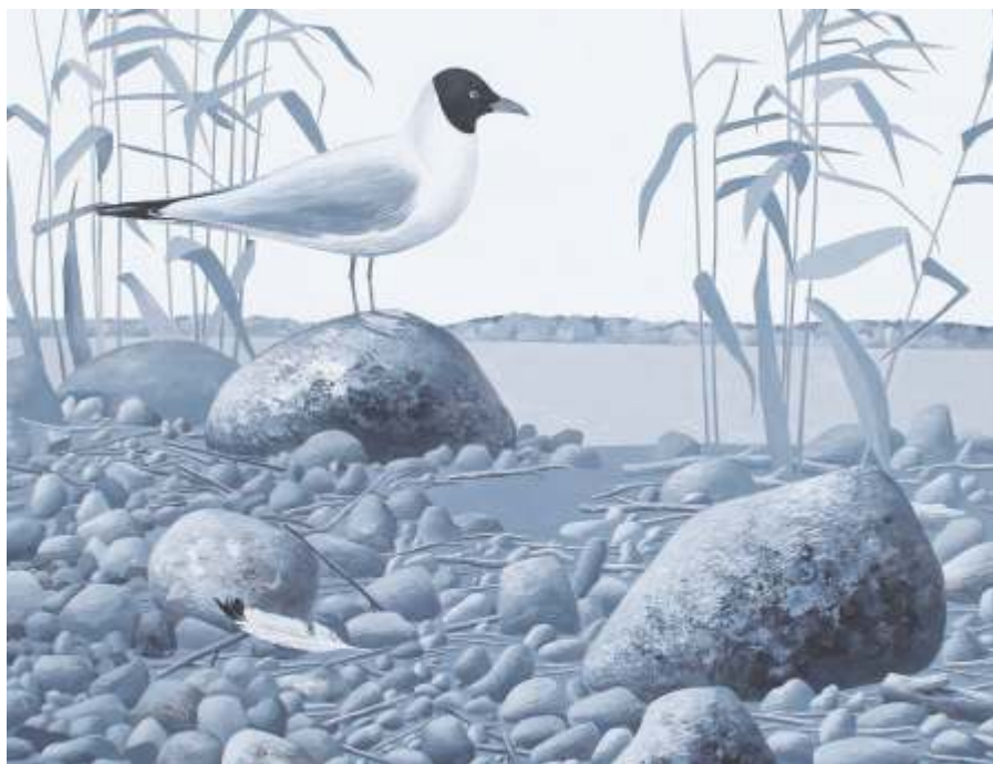
«В зарослях», Петрозаводск, 2012

В графическом листе «В зарослях» из серии «Птицы, камни и травы» изображен тихий пейзаж со спокойными водами отмели, птицей, видом тонких трав, пером, бесшумно спустившимся на землю, сучьями, ветками, галькой, замшелыми камнями, разными по форме, размеру и фактуре. Композиция строится на гамме серых тонов, своеобразной элегии серого, — серебристой воды, бледно-палевого неба, контрасте черно-белого оперения чайки, «характере» камней, тщательной проработке деталей.