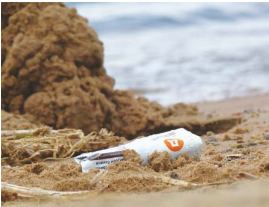
«След человека», Берег Ладожского озера, 2016

Самая большая проблема на земле - это мусор. Может случиться так что он своими объемами заполнит всю ту красоту, которая нас окружает. Давайте не допустим этого!