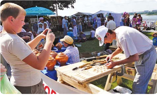
Мастер-класс резьбы по дереву для школьников.

финансирование проектов по развитию малого бизнеса. В недавно созданном уникальном туристическом комплексе «Город мастеров» выполняется проект «Школа подмастерьев», вовлекающий школьников в развитие традиционных ремесел. Здесь с большим успехом прошли мастер-классы по традиционной городецкой резьбе и росписи. В дальнейшем подобные занятия будут регулярно проходить на базе этого комплекса, ставшего своеобразной «визитной карточкой» Городца.